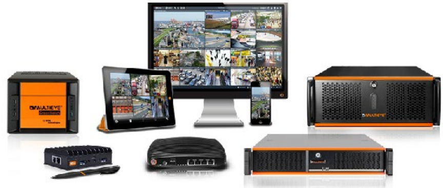
MULTIEYE Produkte für Videoüberwachung